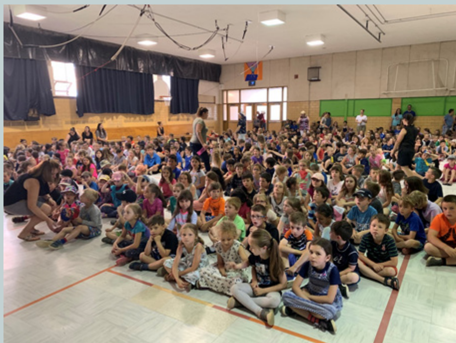
BRIGADE VERTE ÉCOLE SAINT-MICHEL École certifiée