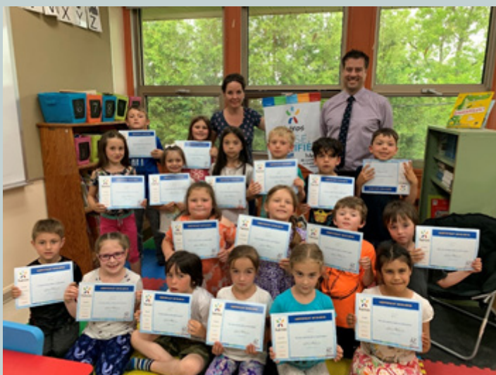
FRIPERIE SCOLAIRE ÉCOLE PROVIDENCE Classe certifiée