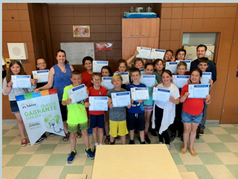
L'ÉCOLO THÉÂTRE ÉCOLE DE TOURAINÉ Classe gagnante