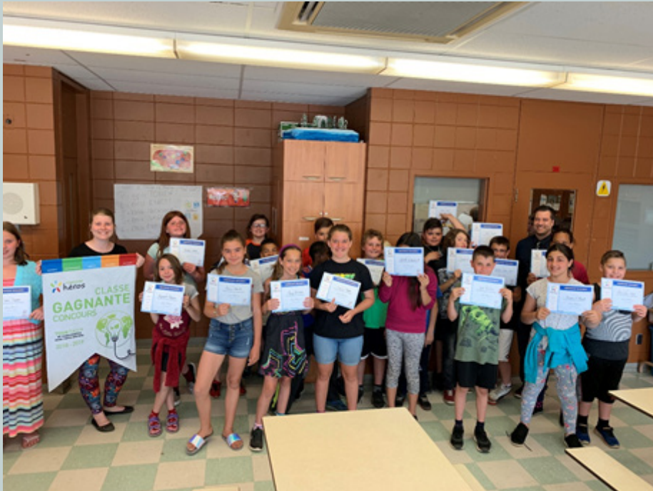
L'ÉCOLE THÉÂTRE ÉCOLE DE TOURAINÉ Classe gagnante